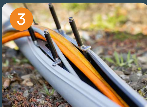
3 Poser le câble dans le tube ouvert