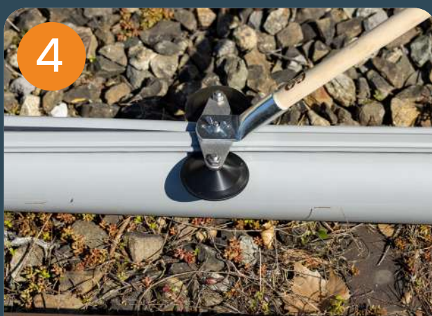
4 Fermer le tube avec l'outil de fermeture